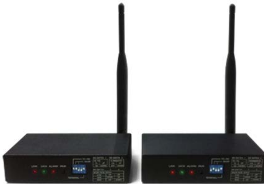
Рис.1 Внешний вид WT2.4/6+WR2.4/6